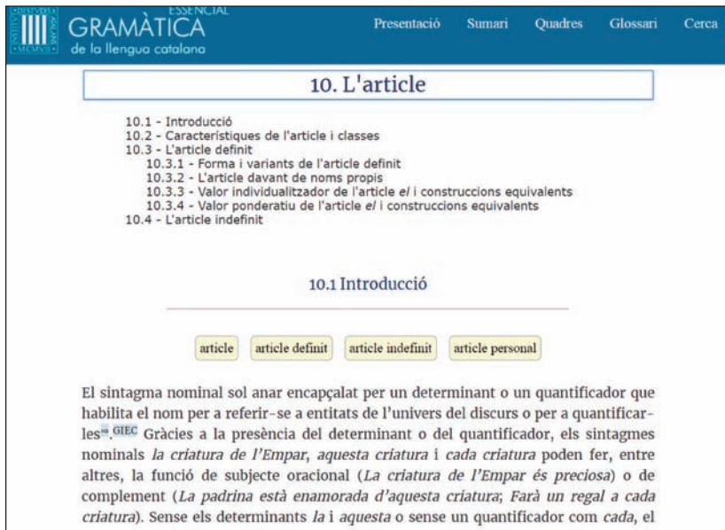
Figura 7. Índex de capítol desplegable (capítol 10).