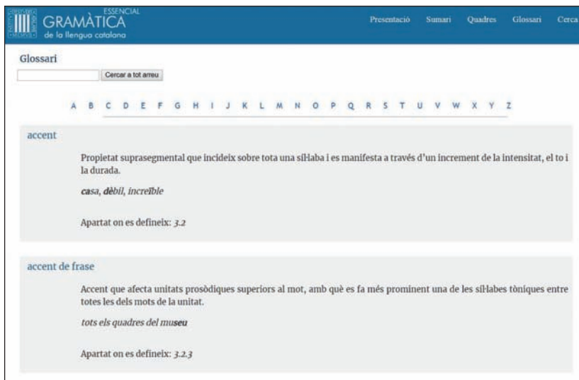
Figura 12. Glossari de la GEIEC.

Cada article inclou el terme, la definició i exemples representatius del concepte definit, així com un enllaç a l'apartat en què es defineix.