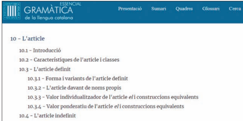
Figura 6. Índex de capítol a través del sumari (capítol 10).